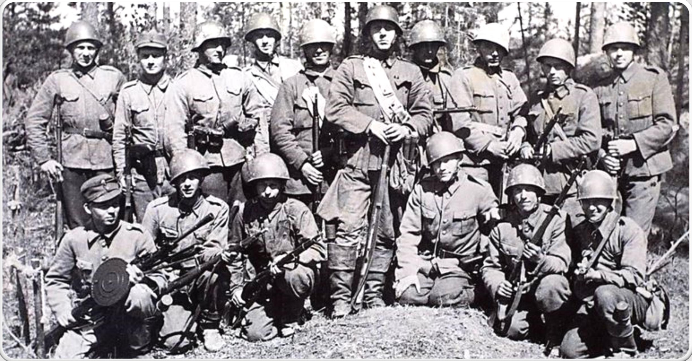
Svenska finlandsfrivilliga 1939-1944