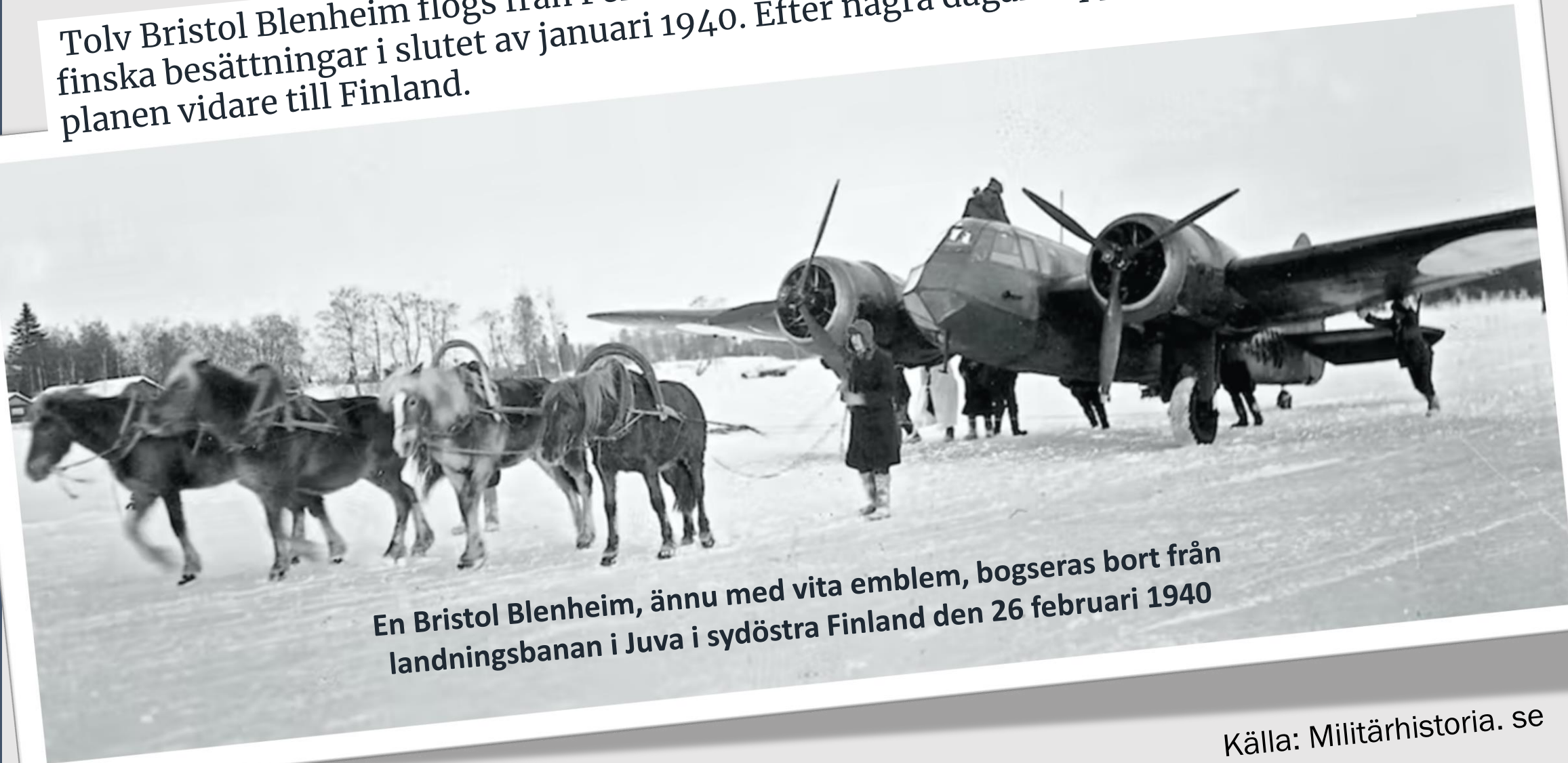
En Bristol Blenheim, ännu med vita emblem, bogseras bort från landningsbanan i Juva i sydöstra Finland den 26 februari 1940

Tolv Bristol Blenheim flögs från Perth i Skottland via Stavanger till Västerås av finska besättningar i slutet av januari 1940. Efter några dagars uppehåll flögs tio av planen vidare till Finland.