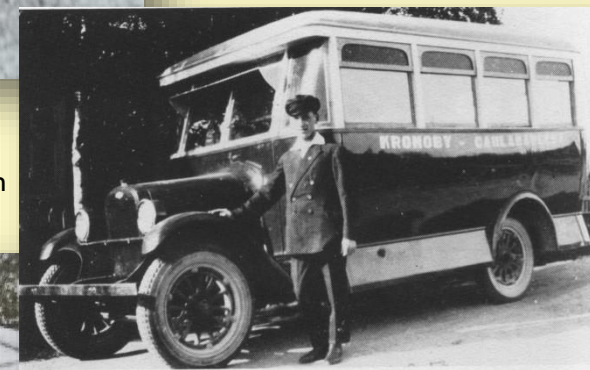
Helge Hallman 1928