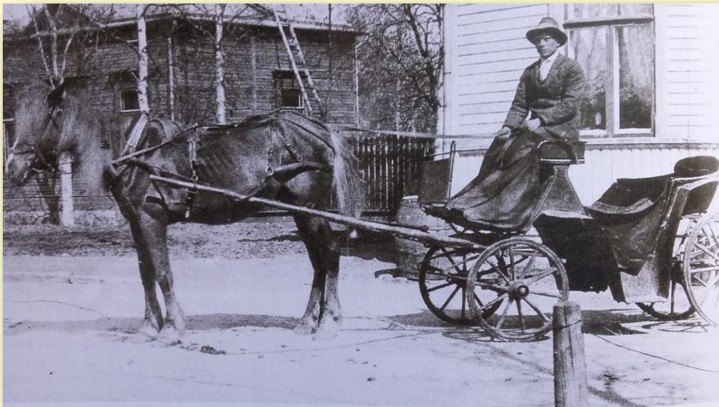
Hästsjuts Fritts Lytts