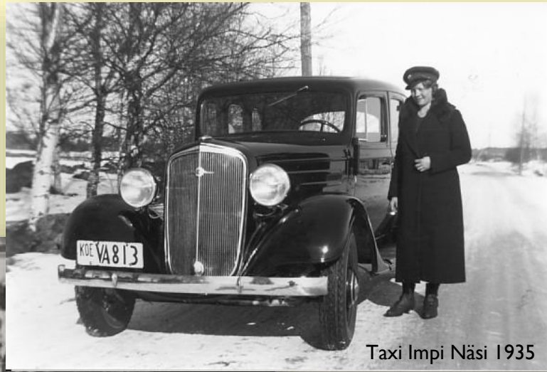
Taxi Impi Näsi 1935