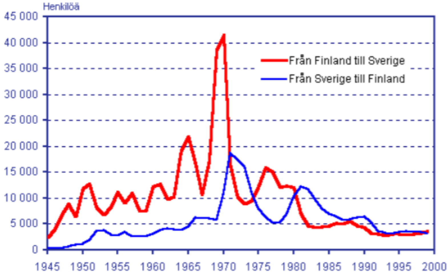
Migration mellan Finland och Sverige 1945–1999

Källa: Befolkningsförändringar (Statistikcentralen, H: fors); figur: Jouni Korkiasaari