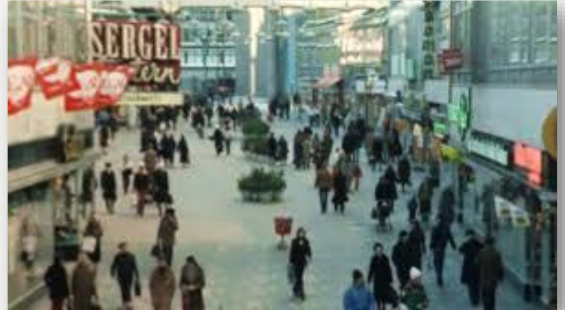
Finländare i Sverige; svenska yle

Efter andra världskriget var Finland ett fattigt land. Arbetsmöjligheterna på landsbygden minskade i takt med att lantbruket automatiserades och samhället industrialiserades. Då det inte fanns jobb i sikte i Finland började man blicka västerut. I Sverige fanns det däremot jobb, främst inom industrin.