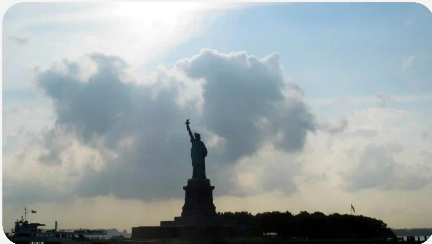
Frihetsgudinnan New York USA