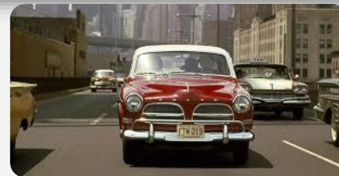
Drömmen: en röd Volvo Amazon